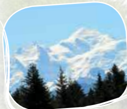
Le Mont Blanc

Facile d'accès, à pied, à vélo ou en voiture, ce splendide site est idéal pour une balade en famille. Vue exceptionnelle sur le Mont Blanc , le lac Léman , la Dent d'Oche et le Jura . Une table d'orientation vous permettra d'identifier les sommets sur 360°.