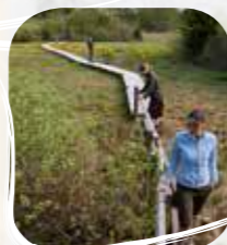
Le sentier du Maravant

Le plateau de Gavot, balcon du lac Léman , accueille une centaine de marais disséminés çà et là. Longtemps méprisés, parfois exploités, souvent redoutés, les marais sont le refuge d'une nature mystérieuse et sauvage. Aujourd'hui, les marais du plateau sont protégés et entretenus.