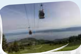
Télécabine de Thollon

Au départ de la station de Thollon , la télécabine vous transporte à quelques pas du sommet des Mémises (1674 m).