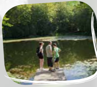
Sentier de la Beunaz

Renseignements dans les bureaux d'information touristique : Bernex 04 50 73 60 72 Thollon 04 50 70 90 01 Visites pour les groupes toute l'année sur réservation.