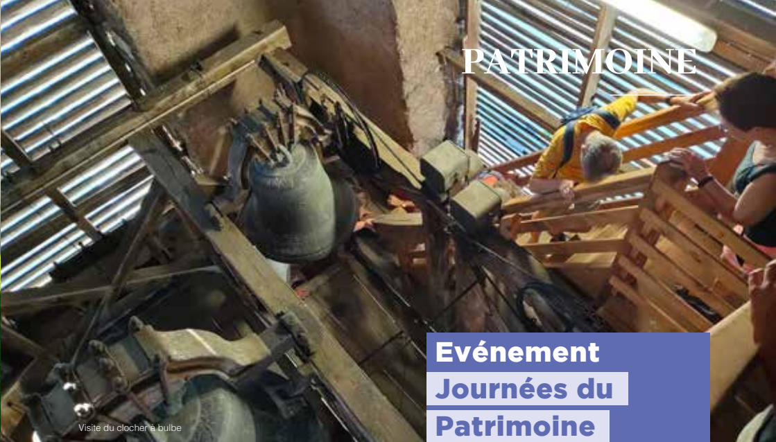
Visite du clocher à bulbe